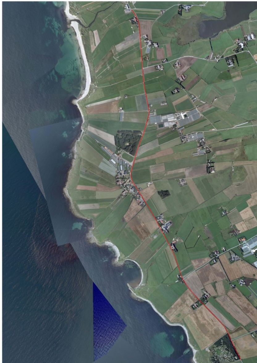
Figur 1 - Bilde av strekninga kor det skal byggjast gang- og sykkelveg

Vegprosjektet blei kalkulert til mellom 39 og 48 mill. 2014- kroner og kan bli finansert via fylkesvegbudsjettet.